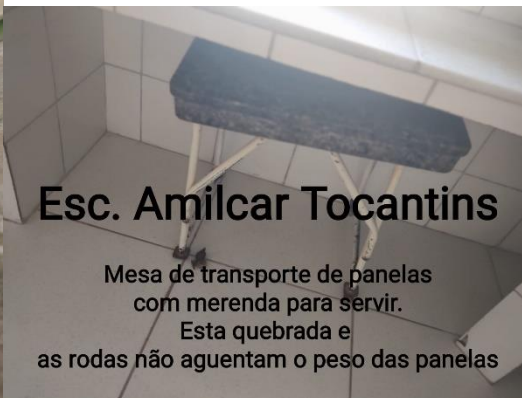
Esc. Amilcar Tocantins

Mesa de transporte de painéis com merenda para servir. Esta quebrada e as rodas não aguentam o peso das painéis