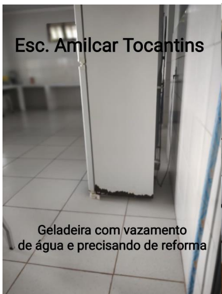
Esc. Amilcar Tocantins

Mesa de transporte de painéis com merenda para servir. Esta quebrada e as rodas não aguentam o peso das painéis