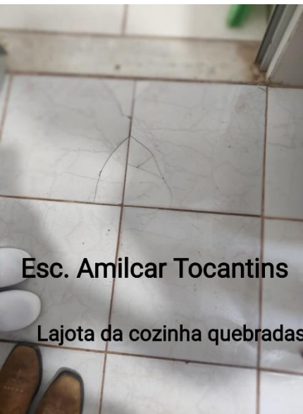
Esc. Amilcar Tocantins

Geladeira com vazamento de água e precisando de reforma