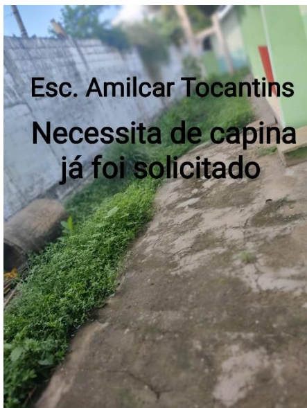
Esc. Amilcar Tocantins Necessita de capina já foi solicitado